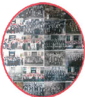
Zoom sur un détail du bâtiment : on y voit les photographies entre autres des promotions 1908,1920,1959,1986,1998, 2001 et 2009.